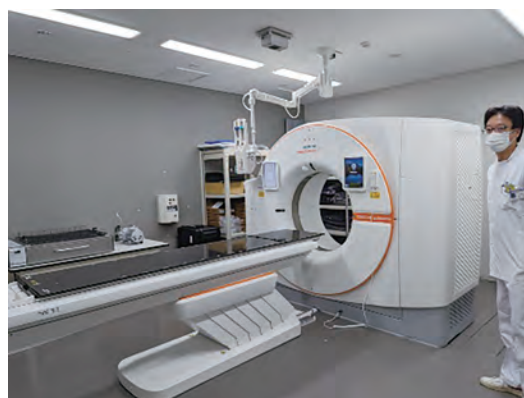
三豊総合病院 視察

次に、令和4年に建て替えられた三豊市立みとよ市民病院を視察した。全室個室ということで、空き病床が減り稼働率が良くなったとのお話があり、参加者も質問をしたり、興味津々の様子であった。