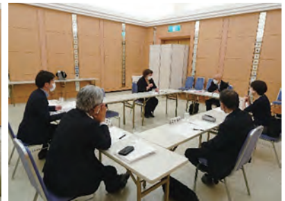
竹下事務部会長（君津中央病院事務局長）挨拶