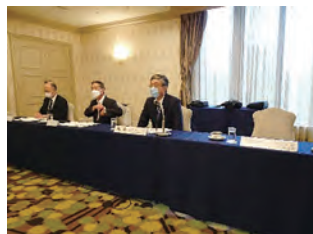
議長：安蒜大綱白里市立 国保大綱病院長