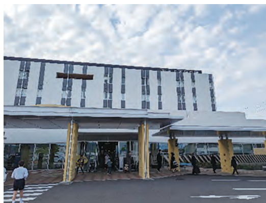
三豊市立みとよ市民病院 外観

次に、令和4年に建て替えられた三豊市立みとよ市民病院を視察した。全室個室ということで、空き病床が減り稼働率が良くなったとのお話があり、参加者も質問をしたり、興味津々の様子であった。