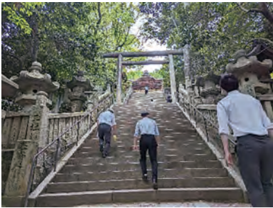
2日目早朝 こんびらさんへのお参り階段785段！