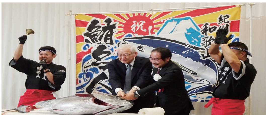
(地域医療交流会の様子)

地域医療交流会では、全国の国保直診関係者が集い、情報交換を行った。マグロの解体ショーが行われ、参加者には切りたてのお刺身が振る舞われるなど大変な盛り上がりを見せた。