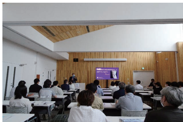
（メーカー講演の様子）