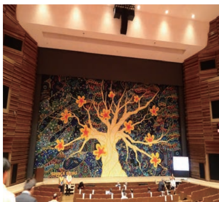
（会場：和歌山城ホール）