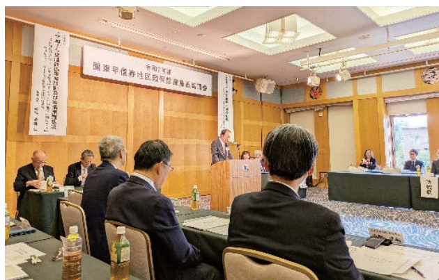
（会議の様子 川口会長挨拶）