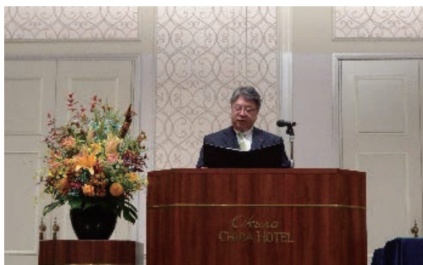
（千葉県井本次長挨拶）