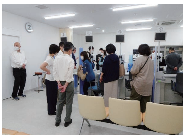
（病院概要の説明、施設視察の様子）

さんむ医療センターの皆様にはお忙しい中、一日がかりでご対応いただき、大変実りのある施設視察研修となりました。ありがとうございました。