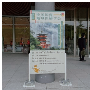
（会場の入り口の様子）