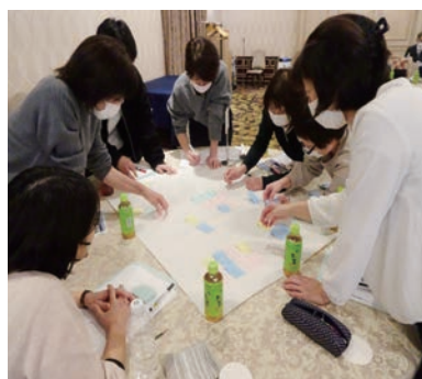
（グループワークの様子）

参加者の皆さんの発表は素晴らしく、講師の方々も感心しておられました。また、お忙しい中、大学での講義等の合間を縫ってご講演いただきありがとうございました。