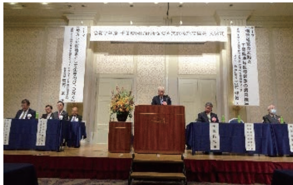
（国診協小野会長挨拶）