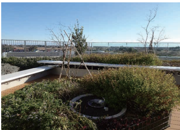
(4階屋上庭園「さんむガーデン」)