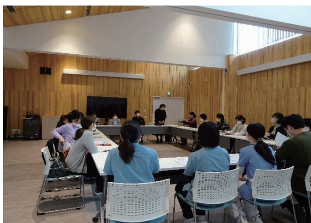
(意見交換会の様子)

さんむ医療センターの皆様には、令和7年度、3度に渡り直診協会の視察研修としてお邪魔しました。お忙しい中、ご対応いただきありがとうございました。